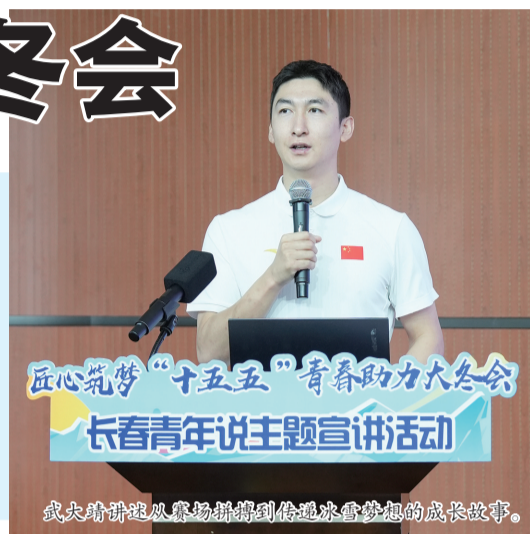
匠心筑梦“十五五”青春助力大冬会 长春青年说主题宣讲活动